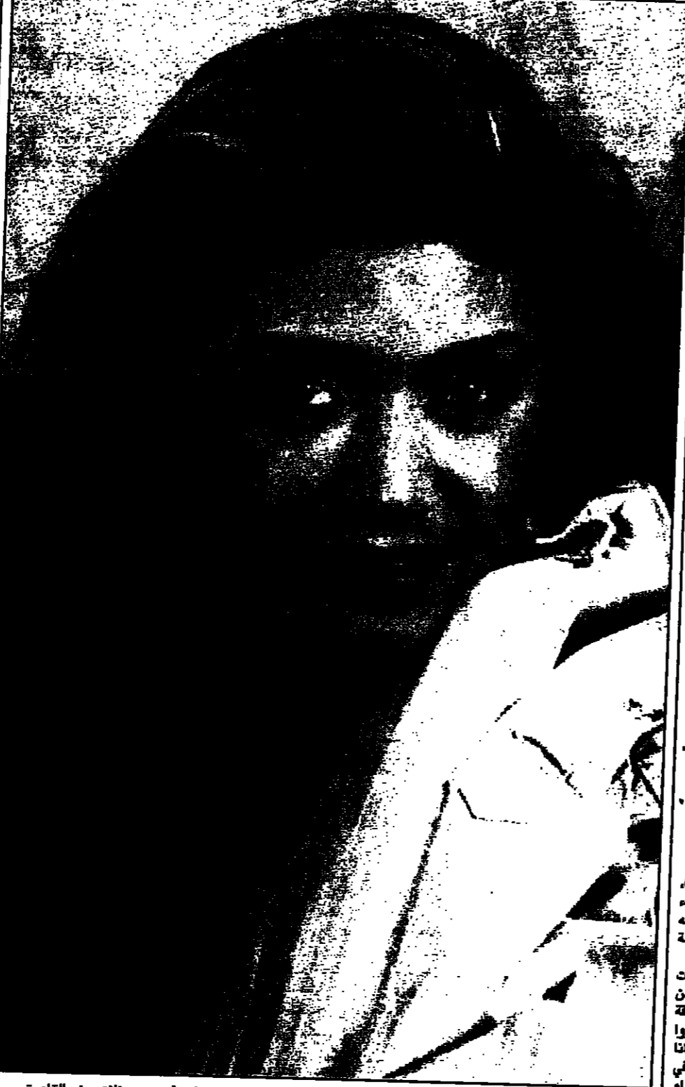
الغناة اللبنانية المغربة نوال الزعيبي اصيحت من المغنيات اللاتي يحصلن على اكبر اجر من حفلاتهن في القاهرة.. بلغ اجرا ما آخر حفل 30 الف دولار.

وتتوقع منظمة الصحة العالمية ارتفاعا في حالات الإصابة وتوقع منظمة الصحة العالمية ارتفاعا في حالات الإصابة